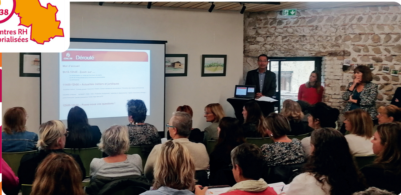
Rencontre RH territorialisée à La Côte-Saint-André en septembre 2024

Le CDG38, partenaire des intercommunalités et des communes, multiplie les occasions d'aller à leur rencontre, et s'inscrit au plus près de leurs besoins, y compris pour les employeurs qui n'ont pas le réflexe de faire appel aux compétences qu'il leur met à disposition.