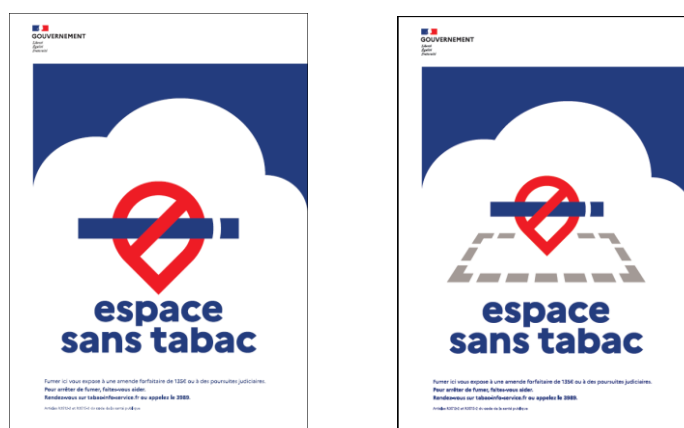
Espace avec périmètre

Les nouvelles signalisations doivent être conformes aux modèles reproduits ci-dessous :